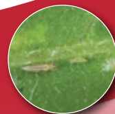
Hama trips Thrips parvispinus