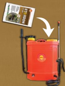
1 Sachet 100 gr untuk 6-8 tangki 15 liter