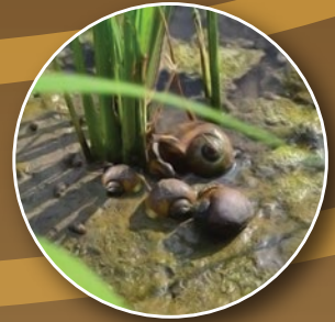
Siput murbei Pomacea canaliculata